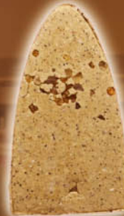
หลังพิมพ์แร่ทาสี