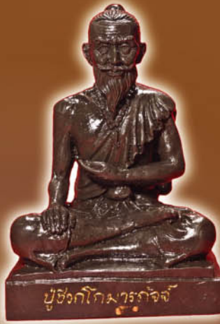
รูปหล่อบูชา 3 นิ้ว