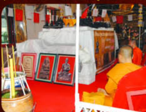
บรรยาภาคในพิธีปลุกเสก