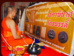
บรรยาภาคในพิธีปลุกเสก