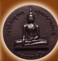
หลวงปู่โต-พระเจ้าตากสิน พลังสะคล่าร์