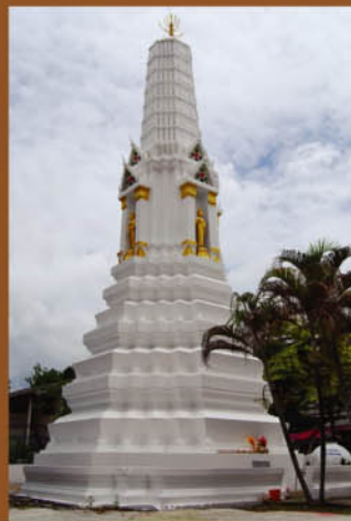
พระปรางค์เก่าแก่