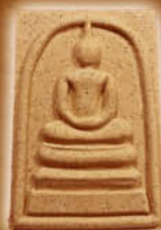
เนื้อพุทธคุณ