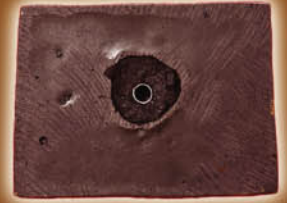
ใต้ฐานรูปหล่อบูชา 3 นิ้ว