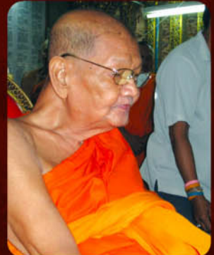
หลวงปู่เจือ นั่งอธิษฐานจิตปลุกเสก