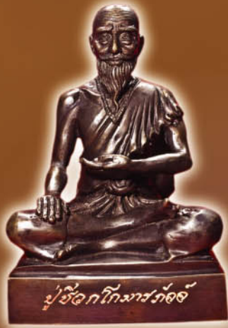
รูปหล่อบูชา 5 นิ้ว