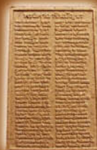
พิมพ์คากาชินบัญชร