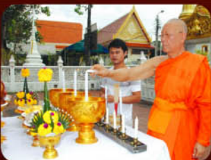
พระครูนิวาสานุวัตร เจ้าอาวาสวัดเจ้าอาาม