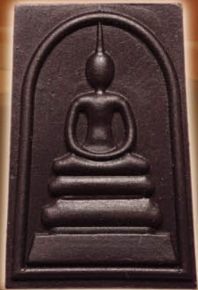
พลังเสถียร เนื้อแร่ลาวาภูเขาไฟ