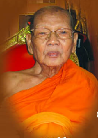
หลวงปู่เจือ วัดกลางบางแก้ว