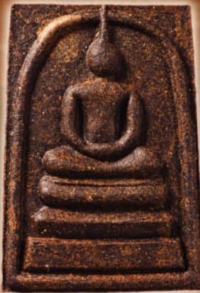
เนื้อผงยาวาสนาจินดามณี