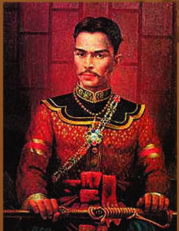
สมเด็จพระเจ้าตากสินมหาราช