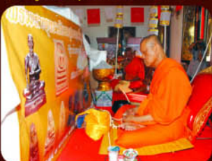
พระราชประสิทธิ์วิมล วัดระมิงฯ

วาระที่ 3 พิธีสมโภชน์ สวดพระคาถาไพฑูริย์คปริตร พุทธมนต์โอสถ 108 คาบ ณ อุโบสถ วัดเจ้าอาาม วันที่ 8-10 มกราคม 2553