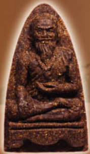
เนื้อผงยาวาสนาจินดามณี