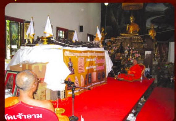
พระเถรจารย์สวดพระคาถาไพฑูริย์คปริตร