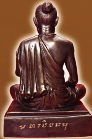
ด้านหลังรูปหล่อ