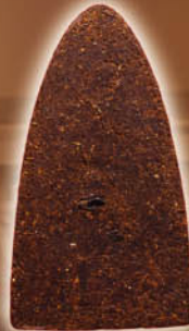
หลังพิมพ์แร่เงินเก่าปี 2516