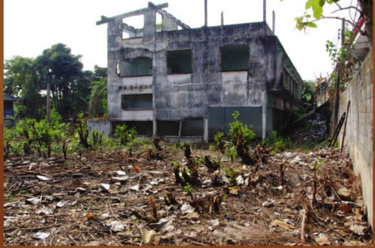
ที่ดินวัดที่จะจัดซื้อ