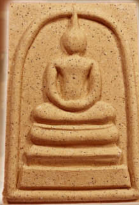
เนื้อผงพุทธคุณ