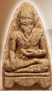
เนื้อไม้มงคล