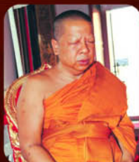
พระโลกนธรรมเมธี วัดสุวรรณคีรี