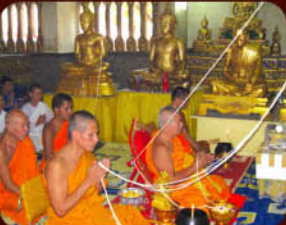
พระเกจิอาจารย์ร่วมปลุกเสก

วาระที่ 2 พิธีพุทธาภิเษก ณ อุโบสถวัดเจ้าอาม บางขุนนนท์ กทม. วันพฤหัสบดีที่ 7 มกราคม 2553