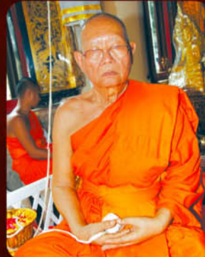
พระครูนิวาสธรรมขันธ์ เจ้าอาวาสวัดเจ้าอาม