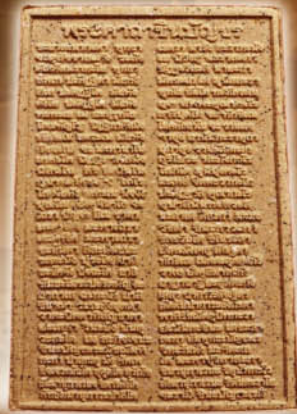
หลังพิมพ์คากาชินบังขร