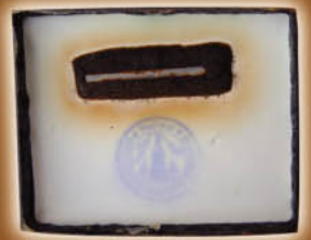
ใต้ฐานรูปหล่อบูชา 5 นิ้ว