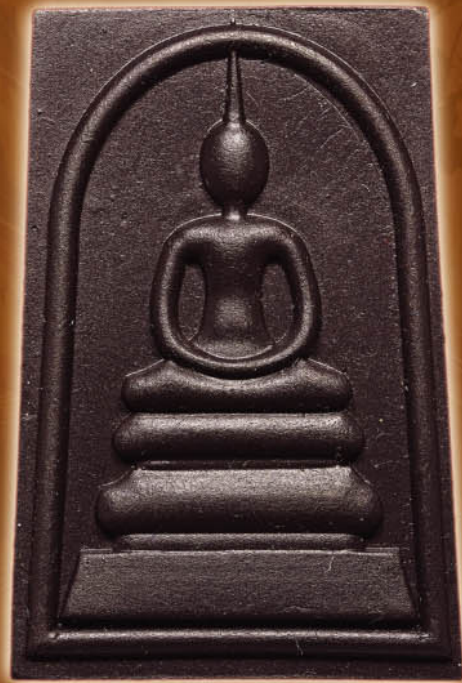
สมเด็จพระชินบัญชร จักรพรรดิ พลังสะคล่าร์