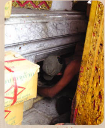
แร่ไม้เก่าศักดิ์สิทธิ์ที่เก็บไว้ได้ยาวนาน หลวงพ่อโตในวิหารวัดเจ้าอาม