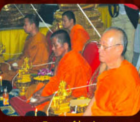
พระเกจิอาจารย์ร่วมปลุกเสก