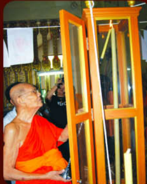
หลวงปู่เจือ ปิยสีโล จุดเทียนชัย

วาระที่ 1 พิธีพุทธาภิเษก โดยหลวงปู่เจือ ปิยสีโล ณ วิหารศักดิ์สิทธิ์หลวงปู่บุญ หลวงปู่เข็มน วัดกลางบางแก้ว อ.นครชัยศรี จ.นครปฐม วันพฤหัสบดีที่ 26 พฤศจิกายน 2552