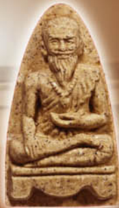
เนื้อผงพุทธคุณ