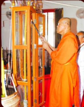
พระราชมงคลธรรมาวุธ วัดระฆังโฆสิตาราม จุดเทียนชัย

วาระที่ 2 พิธีพุทธาภิเษก ณ อุโบสถวัดเจ้าอาม บางขุนนนท์ กทม. วันพฤหัสบดีที่ 7 มกราคม 2553