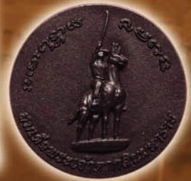
หลวงพ่อโต-พระเจ้าตากสิน พลังเสถียร