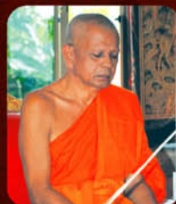
พระครูพิพัฒนวรคุณ วัดนกกอก