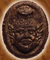
พิมพ์เม็ดยาวาสนาจินดามณี